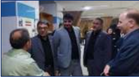
حضور میدانی سرپرست دانشگاه از فولادمحله شهرستان مهدیشهر تا بیمارستان ولایت شهرستان دامغان در راستای پایش کیفیت خدمات سلامت ۱۶/۰۴/۱۴۰۴