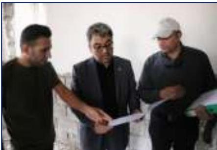
روند پیشرفت پروژه ساخت دانشکده پرستاری و مامایی توسط سرپرست دانشگاه بررسی شد ۱۴۰۴/۰۴/۱۱