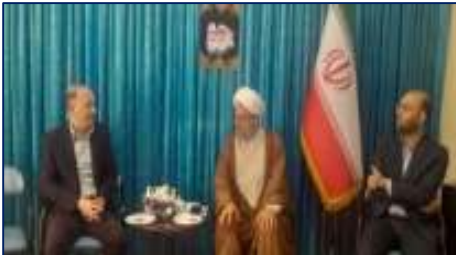
دیدار سرپرست شبکه بهداشت و درمان شهرستان دامغان با امام جمعه شهرستان ۱۴۰۴/۰۴/۰۷