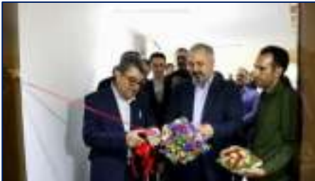
سرپرست دانشگاه علوم پزشکی استان سمنان: افتتاح مرکز تعالی آموزش مجازی و هوش مصنوعی دانشگاه علوم پزشکی استان سمنان، گامی مهم در توسعه آموزش و نوآوری دیجیتال در علوم پزشکی ۱۴۰۴/۰۴/۲۵