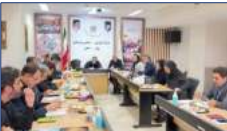
بازدید اعضای تیم ارزیابی عملکرد وزارت بهداشت از مرکز آموزشی، پژوهشی و درمانی دامغان ۱۸/۰۴/۱۴۰۴