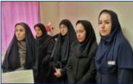
بازدید مدیرکل دفتر امور زنان و خانواده استانداری سمنان از بیمارستان امیرالمومنین (ع) ۱۴۰۴/۰۴/۰۷