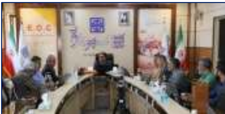
سرپرست دانشگاه علوم پزشکی استان سمنان: سمنان می‌تواند به قطب چشم پزشکی کشور تبدیل شود ۱۴۰۴/۰۴/۰۷