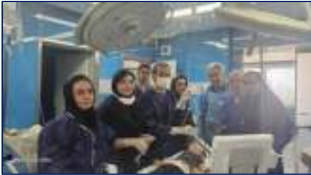
نجات معجزه‌آسای شیرخوار ۱۸ ماهه سمنانی: خروج یادام زمینی از ریه در آخرین لحظات ۱۴۰۴/۰۴/۰۸