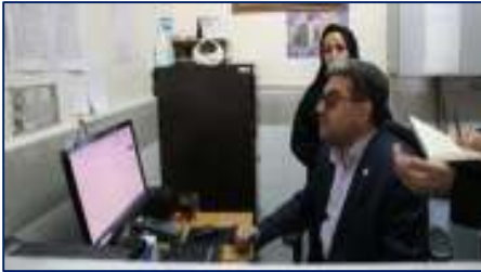
یازدید سرپرست دانشگاه علوم پزشکی سمنان از مرکز خدمات جامع سلامت شهری در جزین ۱۴۰۴/۰۴/۲۴