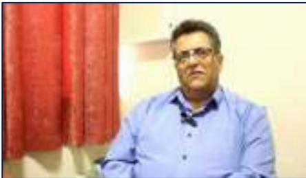
پزشک سمنانی که پیش قدم شد برای تقویت توان موشکی ایران ۱۴۰۴/۰۴/۲۵