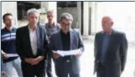
تاکید سرپرست دانشگاه بر تسریع روند اجرای طرح توسعه بیمارستان امیرالمؤمنین (ع) در بازدید از این پروژه درمانی ۱۴۰۴/۰۴/۱۰