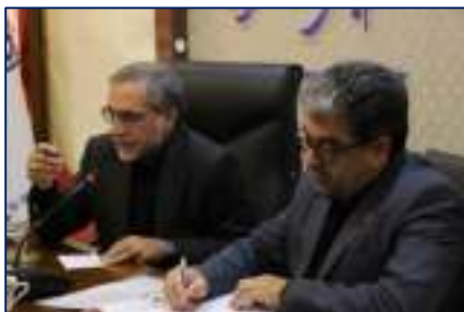
پیکیری مسائل حوزه سلامت در جلسه سرپرست دانشگاه و نماینده مردم شریف سمنان ، مهدی شهر و سرخه در مجلس شورای اسلامی ۱۴۰۴/۰۴/۱۲