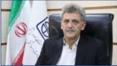
انتصاب سرپرست معاونت توسعه و مدیریت منابع دانشگاه علوم پزشکی استان سمنان ۱۴۰۴/۰۴/۰۷