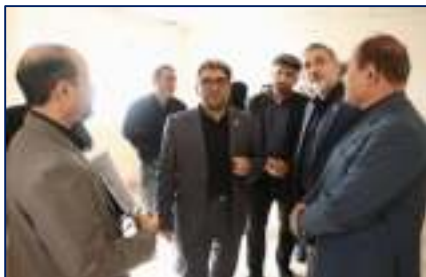
بازدید میدانی سرپرست دانشگاه از دانشکده پیراپزشکی سرخه در راستای ارتقای کیفیت آموزش و رفاه دانشجویان ۱۴۰۴/۰۴/۱۱