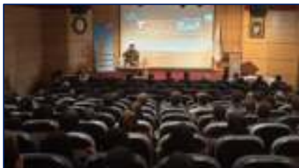
نشست تبیینی وقایع اخیر رژیم صهیونیستی دشمن گذشته، اکنون و آینده ایران در دانشگاه برگزار شد ۱۴۰۴/۰۴/۱۱